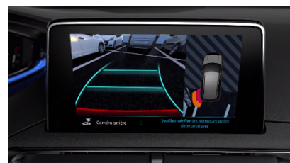
Pack City 1