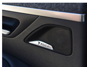
Système Hi-Fi Premium FOCAL®