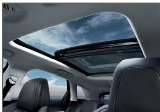
Toit ouvrant panoramique