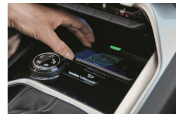
Recharge smartphone sans fil