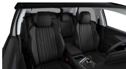
Pack Cuir 'Claudia'