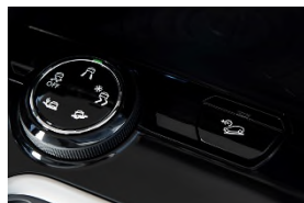
Advanced Grip Control