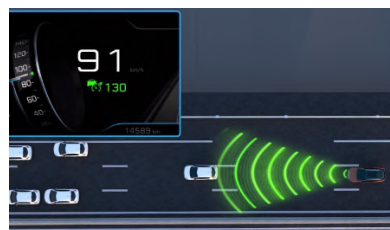
Pack Drive Assist