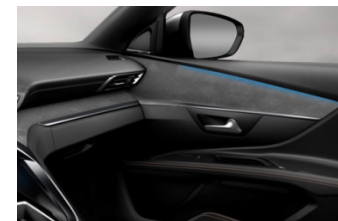
Décors de planche de bord et panneaux de portes Alcantara® gris chiné