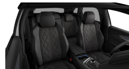
Pack Cuir 'Nappa'