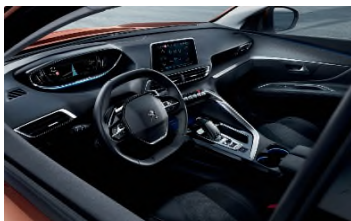
Nouveau Peugeot i-Cockpit*