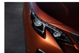
Peugeot Full LED Technology