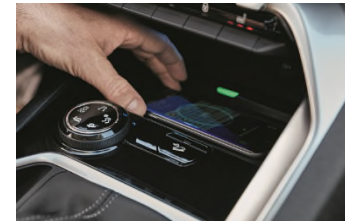
Recharge smartphone sans fil