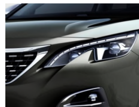
Peugeot Full LED Technology