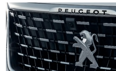
Pack City 2