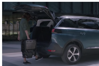
Hayon mains libres