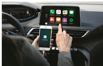
Mirror Screen compatible Apple CarPlay™ (et Android Auto)