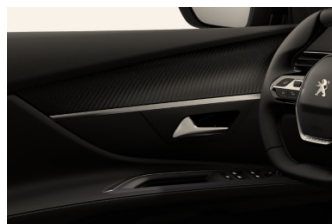
Décors de planche de bord et panneaux de portes Carbone