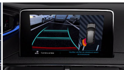
Pack City 1