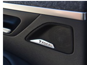
Système Hi-Fi Premium FOCAL®