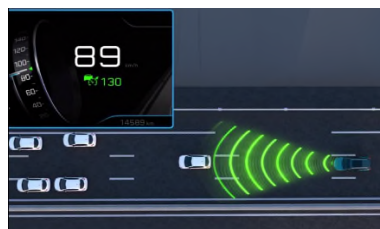
Pack Drive Assist