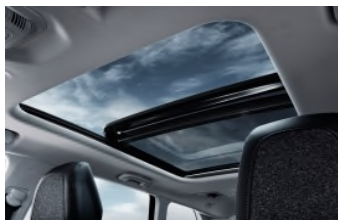
Toit ouvrant panoramique