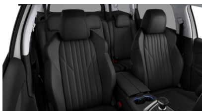
Pack Cuir 'Claudia'