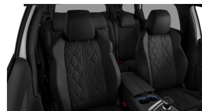
Pack Cuir 'Nappa'