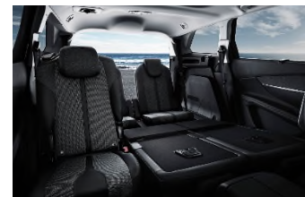
Modularité 7 places