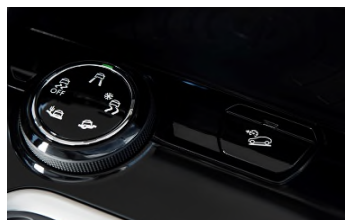
Advanced Grip Control