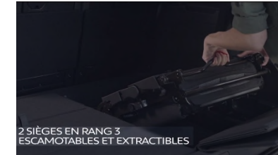
2 SIÈGES EN RANG 3 ESCAMOTABLES ET EXTRACTIBLES