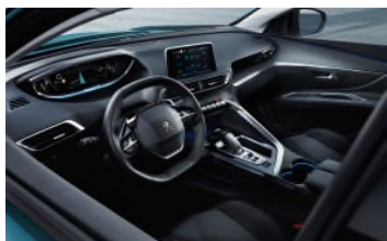
Nouveau Peugeot i-Cockpit®