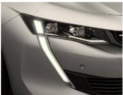
Projecteurs Full LED