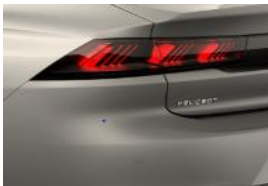
Feux 3D Full LED