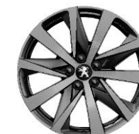
Jantes 18" Hirone bi-ton diamantées et vernis Grey Dust