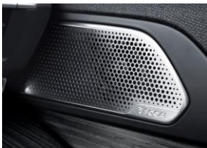
Système Hi-Fi Premium FOCAL