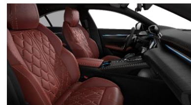
Pack Cuir Sellier Rouge