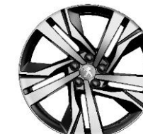
Jantes 19" Augusta bi-ton diamantées