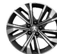
Jantes 17" Merion bi-ton diamantées